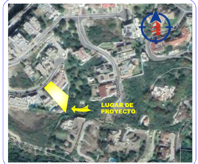
CROQUIS DE LOCALIZACION SIN ESCALA